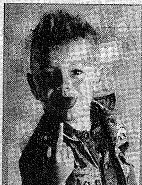
hele og FRIE børn

Af Peter Schmidt = Jørgen Rasmussen. Forlaget Attika, 112 s. 99,- kr.